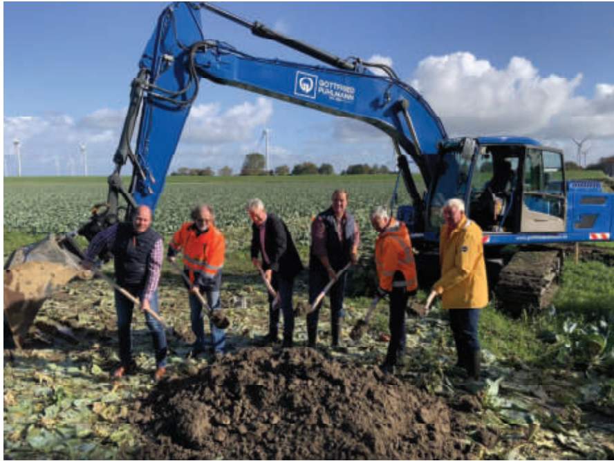
Spatenstich Neuer Radweg - 5.10.2023