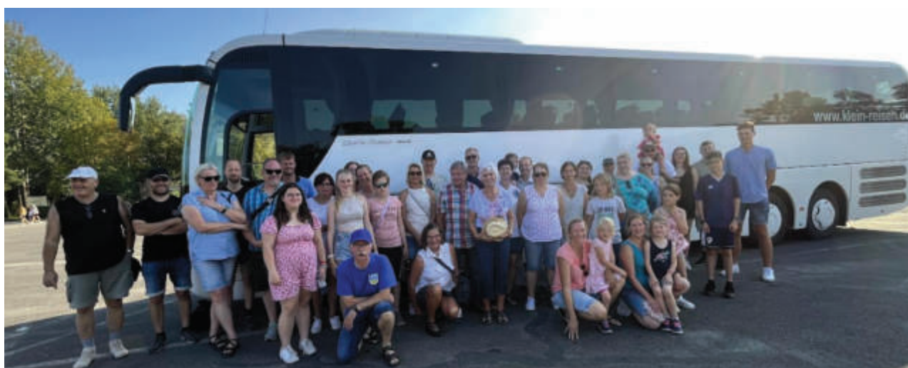
Familienausflug Serengeti-Park 2023

Gemeinnütziger Verein Kaiser-Wilhelm-Koog von 1879 Vereinskonto: DE89 2189 0022 5005 1116 33 Dithmarscher Volks- und Raiffeisenbank